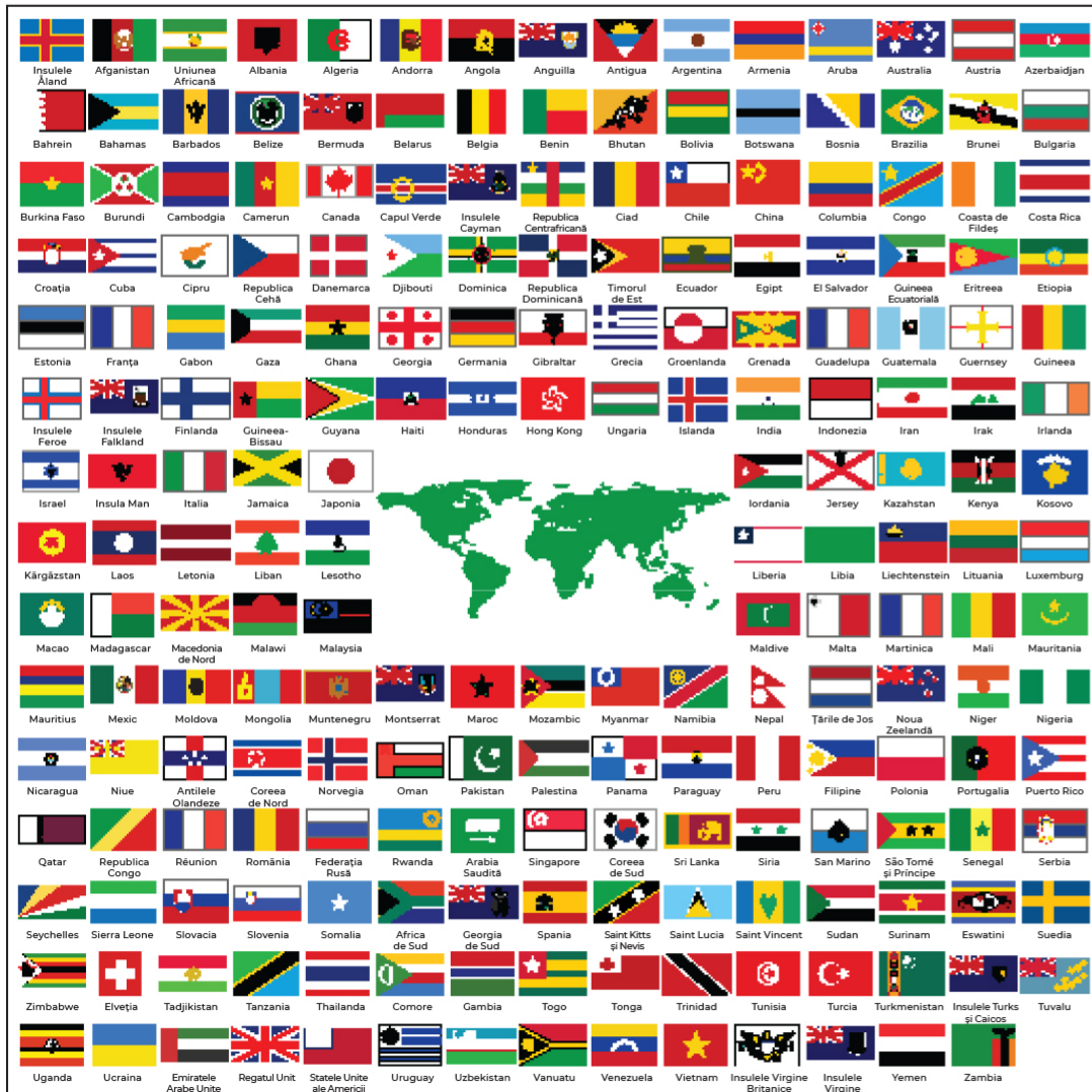
Una dintre versiunile steagului mondial

Steagul mondial sau steagul internațional a fost creat în 1988 de americanul Paul Carroll. Acesta constă în combinația steagurilor tuturor țărilor din lume, aranjate astfel încât să formeze o suprafață pătrată. În centrul acesteia se află un fundal alb, simbolizând pacea și puritatea, iar pe acest fundal alb este reprezentată harta lumii, în verde, simbolizând natura.