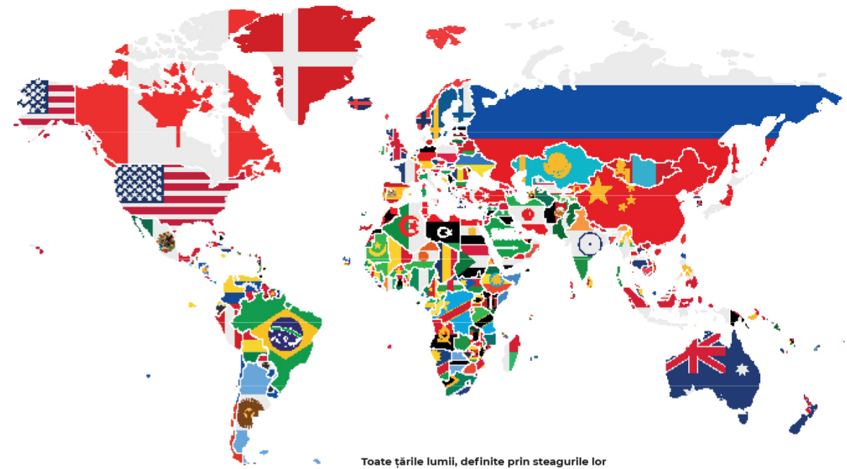
Toate țările lumii, definite prin steagurile lor

Scopul lui Carroll a fost să creeze un simbol al unității și cooperării globale care să fie recunoscut și ușor de înțeles în întreaga lume.