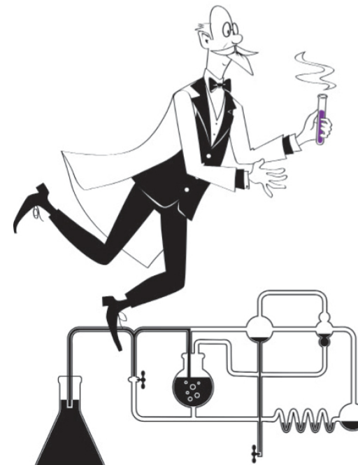
O descoperire întâmplătoare

Pe steagul Nicaraguei, culoarea violet apare pe banda inferioară a curcubeului de pe scutul aflat în centrul drapelului național.